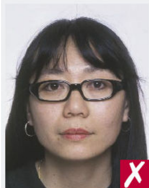
Montures trop épaisses

La photo doit laisser clairement voir ses yeux (pas de verres trop teintés, ni de reflets).