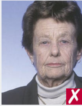
Photo non centrée