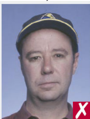
Port d'une casquette