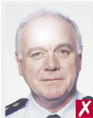
Reflet du flash sur la peau

Avoir un fond de couleur unie et claire.