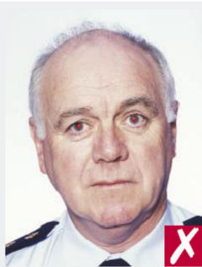
Yeux rouges dus au flash