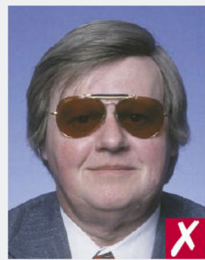
Verres trop teintés