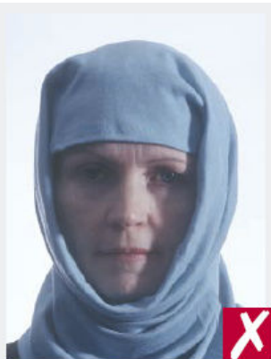
Ombres sur le visage