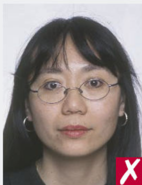
Montures masquant les yeux