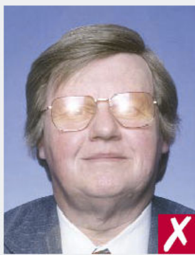
Reflets sur les verres